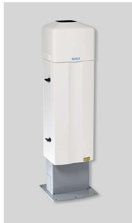
Облакомер CL31 фирмы Vaisala производит измерение высоты нижней границы облаков и вертикальной видимости при любой погоде – хорошей или плохой.

характеристики за счет поддержания окошка в сухом и чистом состоянии. В холодных условиях обогрев стекла исключает его заиндевание.